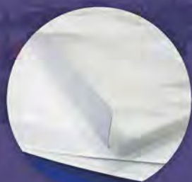
預摺易剝離自黏袋