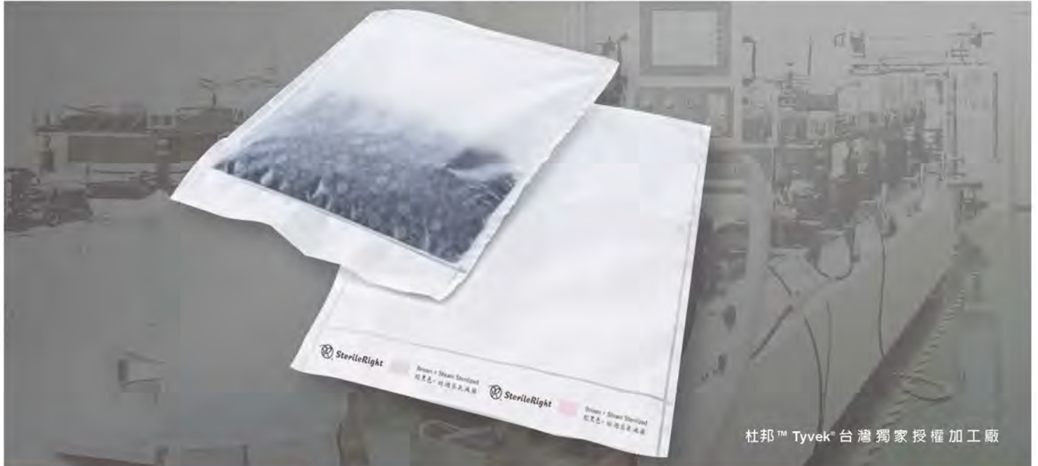
杜邦™ Tyvek® 台灣獨家授權加工廠