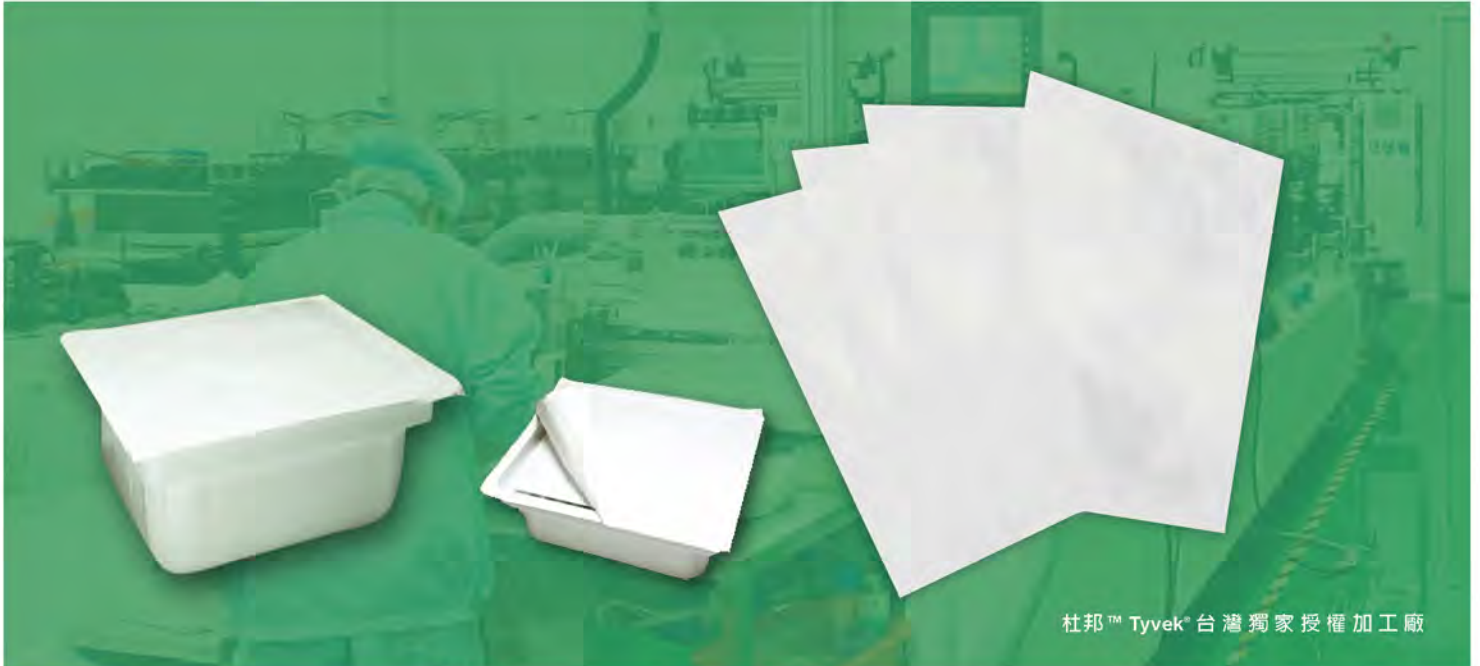
杜邦™ Tyvek® 台灣獨家授權加工廠