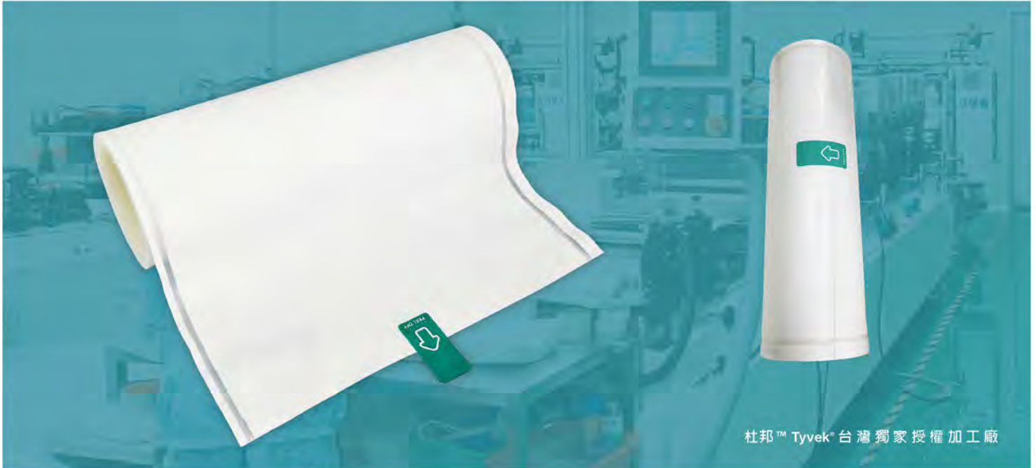
杜邦™ Tyvek® 台灣獨家授權加工廠